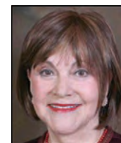
Juez del Tercer Distrito Grace B Durán (División 8)

2. De acuerdo con el Código de Conducta Judicial, mi objetivo es ser justo e imparcial con todos los litigantes que comparecen ante mí. Como juez en una corte de lo penal en un condado diverso, en todos los casos me dedico a conciencia a lograr dicho estándar.