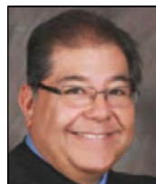
Juez del Tercer Distrito Conrad F Perea (División 3)

necesitamos tratar de ser mejores. El mayor desafío es estar conscientes de nuestros propios prejuicios para poder abordarlos.