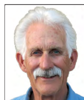
Senador Estatal Distrito 38 Charles Richard Wendler CANDIDATO REPUBLICANO

5. Como estado, necesitamos hacer varias cosas para mejorar nuestras opciones de servicios de salud. Primero, aumentar el transporte desde las zonas rurales del condado a fin de que sus habitantes puedan tener acceso a las citas médicas. Y, como estamos viendo, las opciones de telesalud se han vuelto la norma en las consultas de los doctores y sin embargo en nuestra comunidad existen personas que no tienen acceso a esos recursos o no saben utilizarlos. Necesitamos brindar educación y capacitación a los hogares con esas limitaciones.