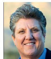
Senadora Estatal Distrito 38 Carrie Hamblen CANDIDATA DEMÓCRATA

5. Respaldo los esfuerzos por establecer el Plan de Salud de NM (de momento no recuerdo el nombre). Hemos destinado fondos para estudiar el plan y los ahorros y ya debemos tomar medidas de acuerdo con los resultados.