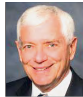
Senador Estatal Distrito 34 Ron Griggs CANDIDATO REPUBLICANO

a la atención médica en clínicas y hospitales.