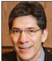
Juez del Tercer Distrito Manuel L Arieta (División 1)

1. Desde la promulgación en el 2019 de las nuevas leyes sobre tutelajes, han disminuido las inquietudes sobre fraude financiero y mala administración en torno a los casos de tutelajes de lucro debido al aumento de reportes y supervisión. Si bien en general las nuevas leyes han sido efectivas y básicamente han logrado su propósito, muchos tutelajes pequeños han experimentado una considerable carga por los informes. En ciertos casos, el precio de la representación legal se ha vuelto prohibitivo. 2. Unos de los principios de la judicatura es dedicarse a la administración de justicia equitativa según las leyes. Sin embargo, así como cambian los tiempos, también cambia el sentido de justicia en la sociedad. Como judicatura, en forma constante debemos tratar de examinar críticamente lo que es justo –no sólo para la sociedad, sino para todas las personas que comparecen ante