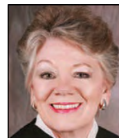
Juez del Tercer Distrito Mary W Rosner (División 4)

1. El estado de Nuevo México ha tomado numerosas medidas respecto a la necesidad de fomentar y proteger el bienestar de las personas incapacitadas. El establecimiento de estatutos y reglas sumado a las recientes enmiendas en los estatutos y las reglas reflejan que el estado y sus juzgados están concentrados en brindar dicha protección de manera más eficaz. Lo que a mí me inquieta en torno a los tutelajes de lucro es que el tutelaje se vuelva más una propuesta comercial y que la conexión personal pudiera perderse. 2. Mi opinión es que en nuestra jurisdicción los juzgados hacen una labor ejemplar de manejo eficaz de los prejuicios raciales y de género. Los prejuicios raciales y de género preocupan mucho hoy en día, pero se trata de inquietudes que han sido importantes a lo largo de nuestra historia. Los tribunales deben abordar dichos prejuicios usando lenguaje respetuoso, a fin de incluir comunicación no verbal que también sea respetuosa y eficaz. El comportamiento y la actitud del juez tienen un gran efecto en todos los participantes en la sala del juzgado.