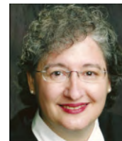
Juez del Tercer Distrito Lisa C Schultz (División 5)

decisiones respecto a los parientes de uno se ha transferido a un negocio y los familiares quedan marginados o excluidos. 2. La desigualdad de género y racial es algo que ya se ha abordado en nuestros estatutos. Todos los que comparecen en el juzgado deben ser tratados igual, independientemente de su color, religión o preferencia sexual. Sin embargo, ahora que la falta de justicia social y los problemas de desigualdad están a la vista del electorado de forma tan dramática, yo intento ser más consciente, más sensible con todos los seres humanos que comparecen ante mí.